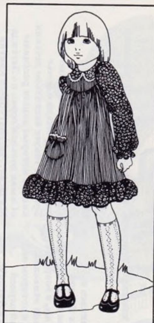
Сарафан из рубчатого велльвета с воротником, рукавами и сборкой вокруг подола. Материал – смесь шерсти с хлопком. Модель «Маркс и Спенсер»