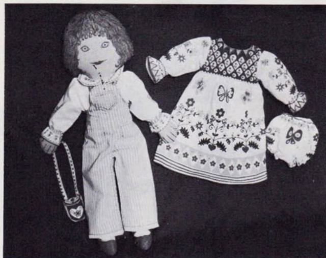
Слева: кукла «Клоткитти», которую вы можете сшить по выкройке, помещенной сверху