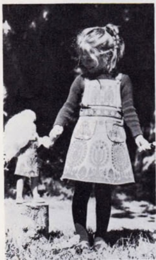
Юбка с нагрудником фирмы «Клоткитс». Украшение заимствовано от польских узоров. Патронки самого малого размера сопровождаются выкройкой юбки для куклы

класс, громадная карусель в форме проигрывателя, замок, обнесенный рвом с водой, мухомор, где можно было полакомиться мороженым — все это служило фоном