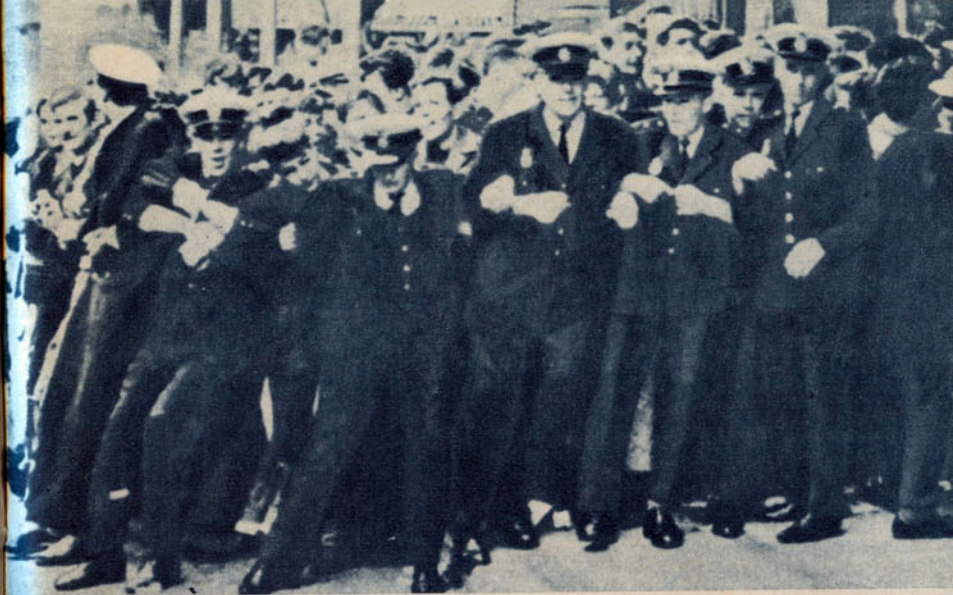
Beatle 'ite lend kulges ettearvestatule hämmostavalt lähedast trajektoori mööda