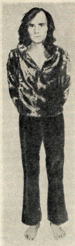
«Иисус-сатана» убийца из Лос-Анджелеса Чарльз Мэнсон

Добравшись до Беркли, он устроился жить у своего приятеля по тюрьме. Потом перебрался в Сан-Франциско. Познакомился там с хиппи. Быстро понял, что из этих слабых, безвольных людей, отрешившихся от цивилизации, при желании можно вить веревки, и решил стать их вожаком и хозяином. Гостеприимные хиппи, узнав, что он долгие годы провел в тюрьме, жалели его, принимая за невинную жертву, кормили, одевали, угощали наркотиками, научили играть на гитаре и петь. А Мэнсон тем временем вынашивал далеко идущие планы.