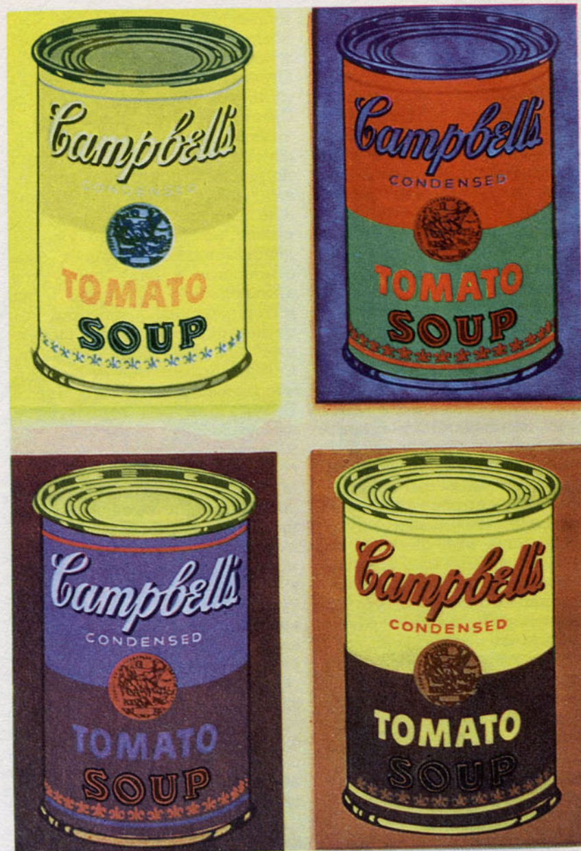
Картина Энди Уорхола «Четыре консервные банки с супом «Кэмпбелл»» (1965).

Со своей стороны, хочу признаться, что когда я вижу у себя на кухне настоящую консервную банку с этими консервами, то не могу удержаться от соблазна взять ее в гостиную и поставить рядом с какой-нибудь картиной, словно неожиданно найденное «произведение Уорхола». Круг замкнулся, предмет поп-арта, несомненно, подлинный. Все остальное теперь кажется старинными реликвиями какой-