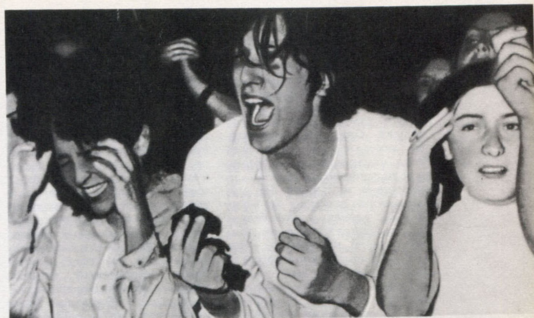
...И их экзальтированные слушатели.