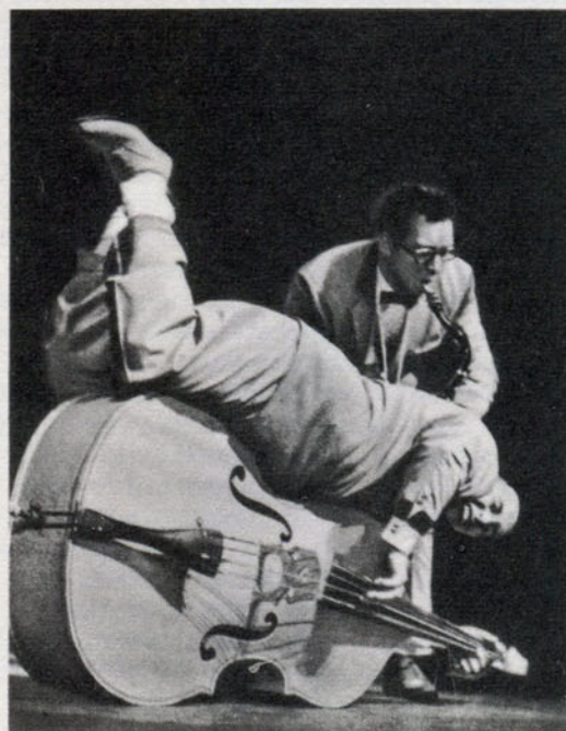
Музыкальные «звезды» на эстраде...