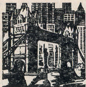
ЛЮДМИЛА ГЕРАСИМОВА АРНОЛЬД ВОЛЫНЦЕВ