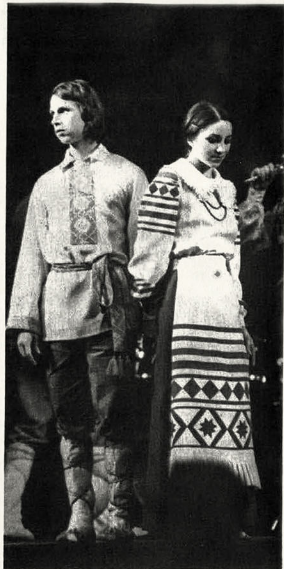
«Песнь о доле».